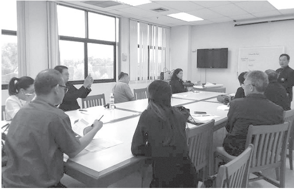
ภาพที่ 1 การจัดเวทีสนทนากลุ่ม

นักวิชาการจากมหาวิทยาลัยเชียงใหม่ จำนวน 2 ท่าน นักวิชาการจากมหาวิทยาลัยพายัพ จำนวน 2 ท่าน และ นักวิชาการจากมหาวิทยาลัยเทคโนโลยีราชมงคลล้านนา จำนวน 1 ท่าน แสดงดังภาพที่ 1